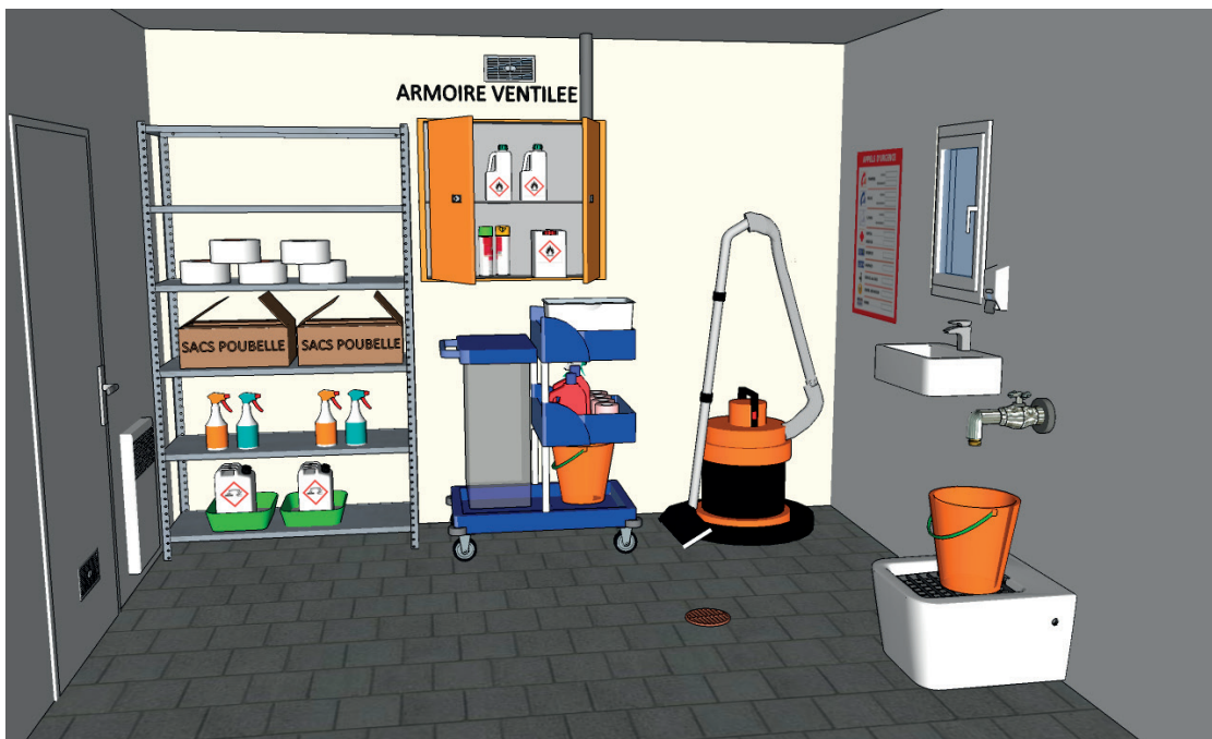
Configuration type d'un local ménage

Hauteurs de rangement recommandées : entre 40 cm et 140 cm